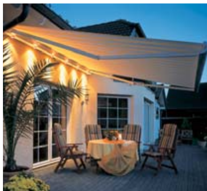
... Ihre Terrassenbeleuchtung Lichtleiste Lux ...