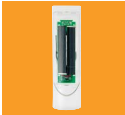
Sonnensensor WeiTronic Lumero-868 Der reine Sonnensensor ohne Windfunktion kann mit einem WeiTronic Remoto 1M oder WeiTronic Remoto 5M aktiviert oder deaktiviert werden. Er braucht keine elektrische Zulei- tung, da er mittels Solarzelle betrieben wird. Geeignet für windunabhängige Markisen z. B. WGM Sottezza.