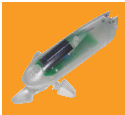
Sonnen- und Windautomatik WeiTronic Aero-868 solar Er „gehört“ dem WeiTronic Re- moto 1M und WeiTronic Remoto 5M . Er fährt die Markise automa- tisch bei Wind ein und bei Sonne aus und braucht keine elektrische Zuleitung, da er mittels Solarzelle betrieben wird.