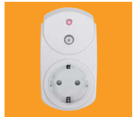
Funksteckdose WeiTronic Combio-868 ST Funksteckdose zum Schalten von beliebigen Stromverbrauchern bis zu einer Leistung von 2000 W. Nur zum Einsatz in trockenen Räumen geeignet.