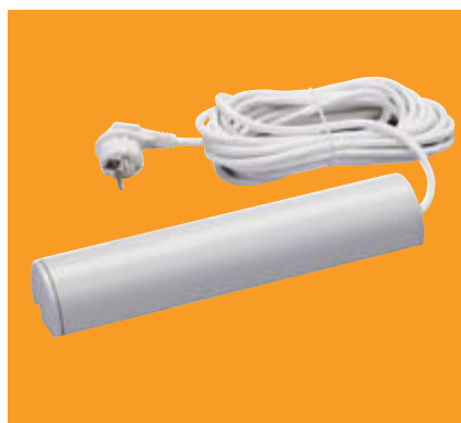
WeiTronic Combo-868 HD 1,5 kW in Designleiste

Der jeweilige WeiTronic Funkempfänger kann für die Steuerung von Markisen oder die des Heizsystems Tempura außen unauffällig befestigt werden. Ihr Vorteil: Im Servicefall tauschen Sie nur den Empfänger nicht den ganzen Motor aus. Zudem ist das WeiTronic System kompatibel zum Elero-Funksystem und dadurch breit einsetzbar.