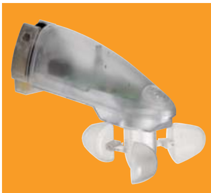
Sonnen- und Windautomatik WeiTronic Aero-868 AC 230 Er arbeitet mit einer 230 Volt- Leitung und lässt sich mit dem WeiTronic Remoto 1M oder WeiTronic Remoto 5M Handsen- der aktivieren oder deaktivieren. Er fährt die Markise automatisch bei Wind ein und bei Sonne aus.