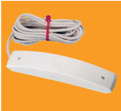
Funkempfänger WeiTronic Combio-868 MA Funk-Empfänger für Markisen- antriebe