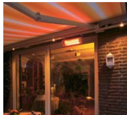
... und zusätzlich Ihr Heizsystem Tempura .