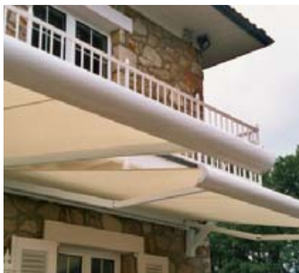
Steuern Sie per Funk Ihre Markisen ...